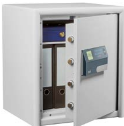
DS 445 E FP