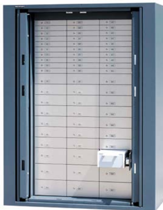
BWP 1902 AVEC COMPARTIMENTS BANCAIRES