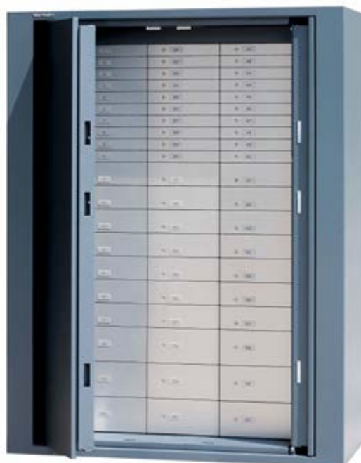
BWP 1902 AVEC COMPARTIMENTS BANCAIRES