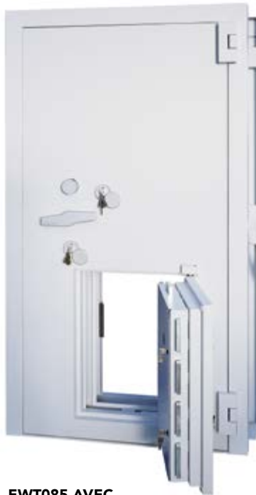
EWT085 AVEC PORTE DE SECOURS

Les portes-fortes des chambres fortes sont des portes massives et blindées qui bloquent ou libèrent l'accès à la chambre forte. En fonction du niveau de sécurité de la chambre-forte, la porte-forte est également certifiée avec différents degrés de résistance. Il faut veiller à ce que la chambre-forte et la porte-forte soient.