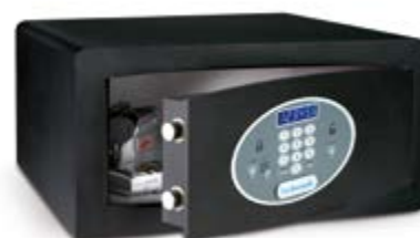
HDE / 4HN