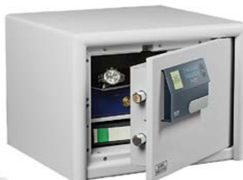
DS 425 E FP