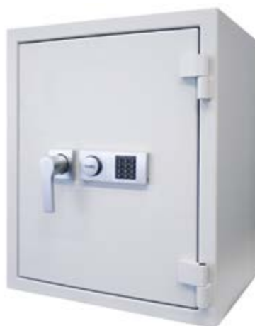
ZURICH PLUS 70503