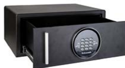
DS / 5HN