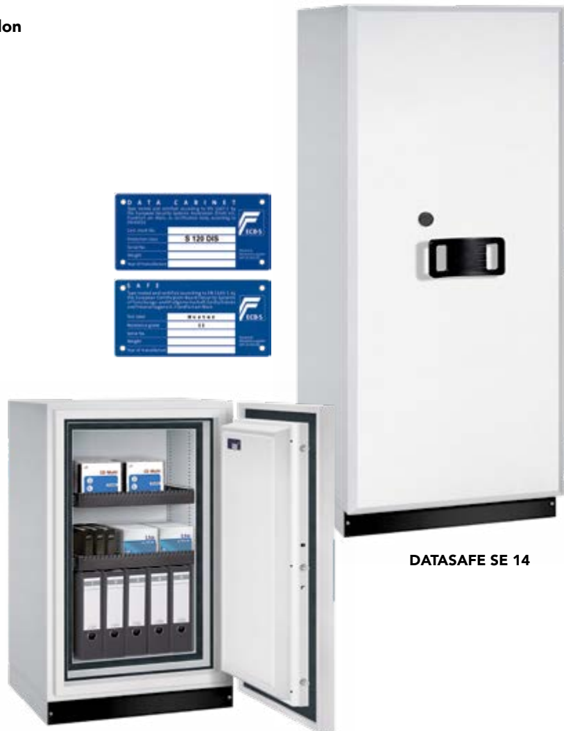
DATASAFE S 13