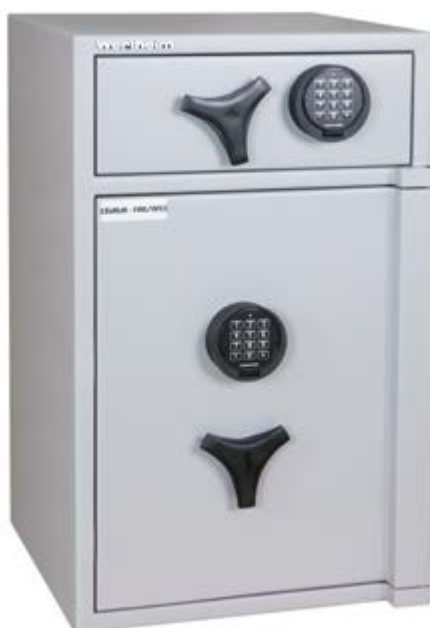
AG 20 DF