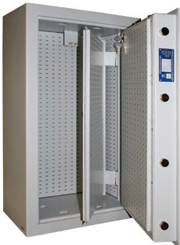
KEY-SAFE FORTE 61407