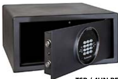
TSB / 4HN-RF