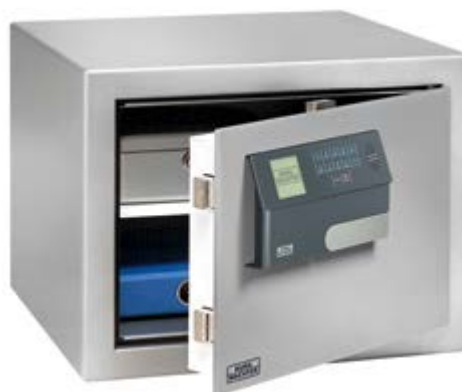
MT 640 E FP