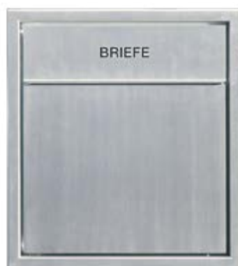
229500 VUE FRONTALE