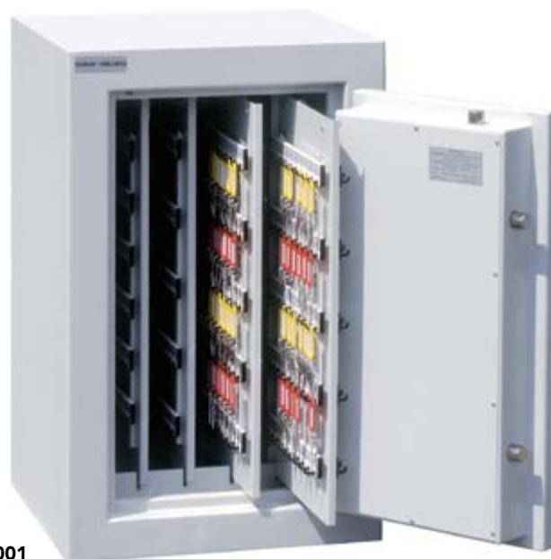
KEY-SAFE TELE 15001