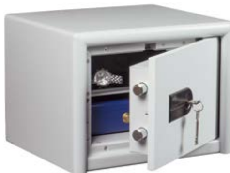
DS 415 K