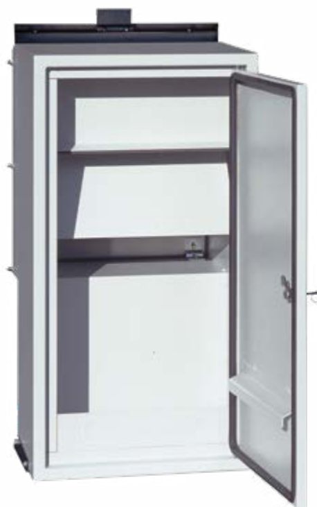
229500 VUE ARRIÈRE