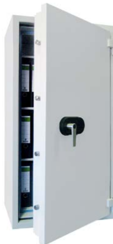
ZURICH PLUS 70506