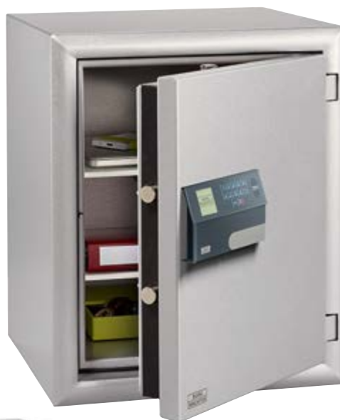
MTD 760 E FP