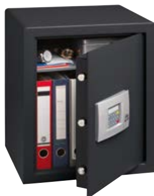
POINTS SAFE P4E