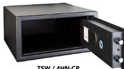
TSW / 4HN-CP