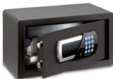
TSW / 1HN