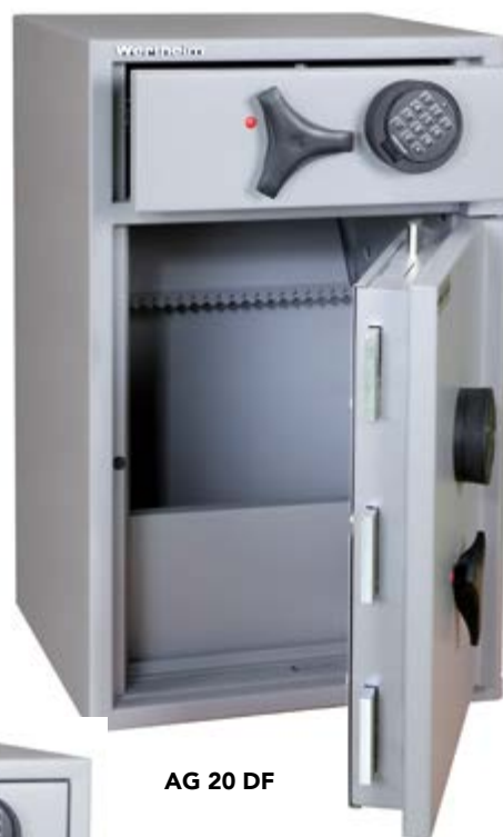
AG 20 DF