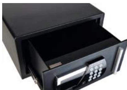
DS / 2HN