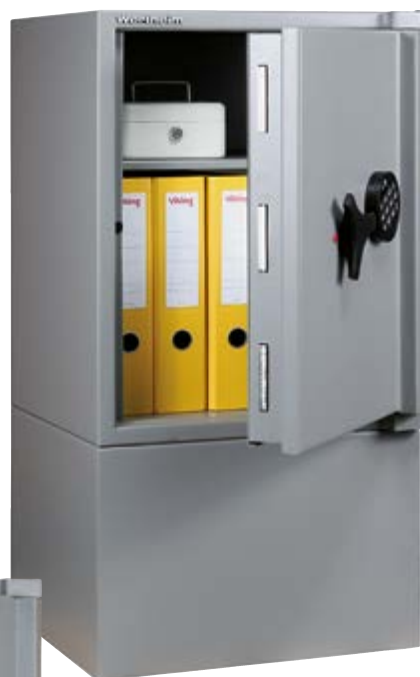
BG 15 AVEC SOCLE