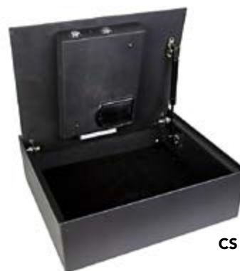
CS / 4HN