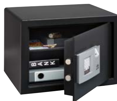
POINTS SAFE P3E FS